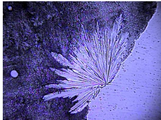
Wasserprobe behandelt mit dem Quellwasser-Generator, 400fach vergrößert